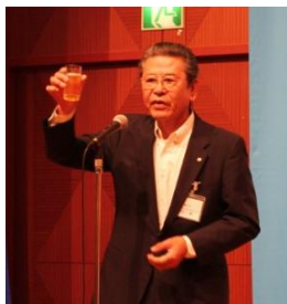
荒金顧問による乾杯