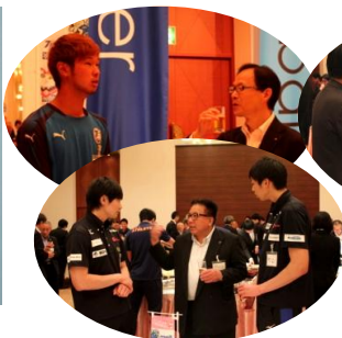
会員と選手の交流の様子