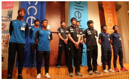
パートナーチーム選手入場