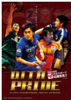
〈クリアファイル 表〉

パートナーチームを身近に感じるよう選手写真と試合日程を掲載したタウスポオリジナルクリアファイルを作成し、大分市内小学校全児童（約27,000枚）等に配布した。