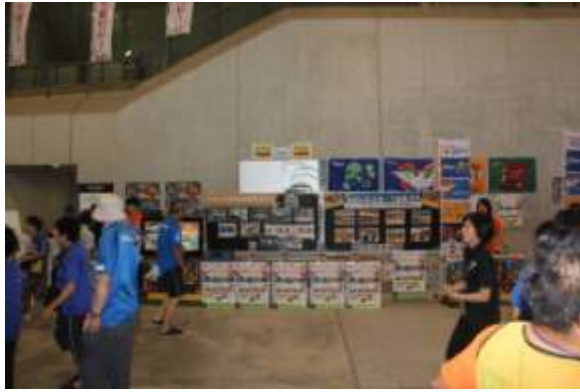
＜ 協議会ブースの様子 ＞