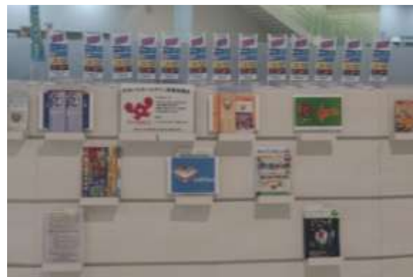
＜ ミニコーナー ＞