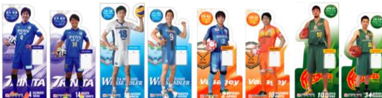
〈 4チーム選手等身大パネル 〉

選手の等身大パネルを各チーム2体ずつ作成し、地域交流イベントや試合会場等に設置しパートナーチームのPRを行った。