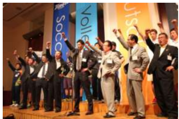
〈 会員、パートナーチームによるガムラン三唱 〉