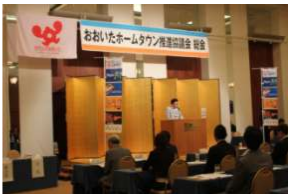
〈 総会の様子 〉

内容 ・報告第1号 平成25年度 事業報告について ・報告第2号 平成25年度 決算報告及び会計監査報告について ・議案第1号 平成26年度 監事選任(案)について ・議案第2号 平成26年度 事業計画(案)について ・議案第3号 平成26年度 予算(案)について 報告、議案について全て承認された。 総会終了後、タウスポ交流会を開催。(参加者数83名)