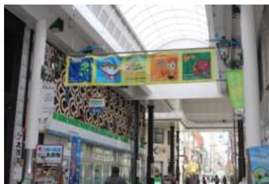
〈商店街パートナーチーム応援横断幕〉