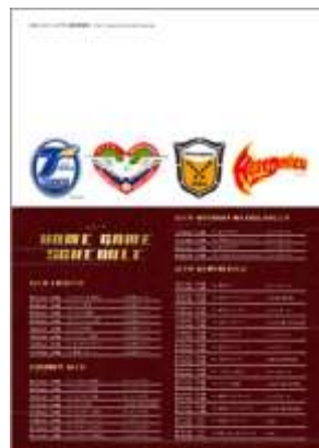
〈クリアファイル 裏〉