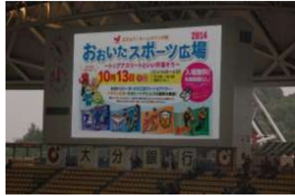
＜ 大型ビジョンでのPRの様子 ＞