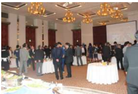
〈 タウスポ交流会の様子② 〉