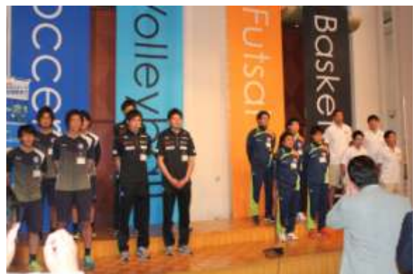
〈 タウスポ交流会の様子① 〉