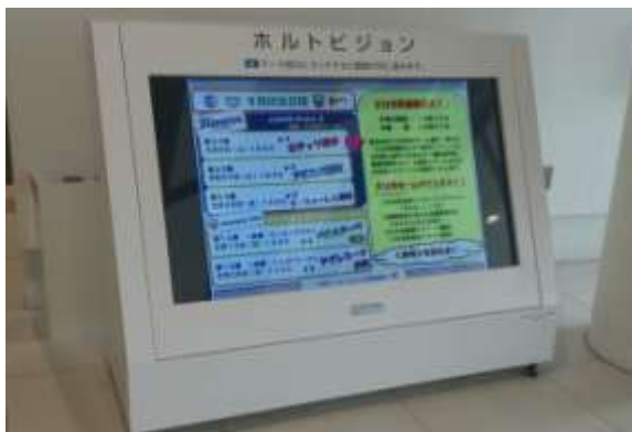
＜ デジタルサイネージ ＞

「ホルトホール大分」にご協力いただき、デジタルサイネージでチームの試合日程等を告知するとともに、エントランス内に協議会のミニコーナーを設置した。