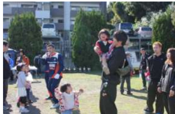
〈 清掃活動・交流の様子 〉