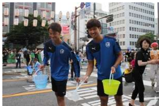
〈 打ち水大作戦 選手・マスコットの様子 〉