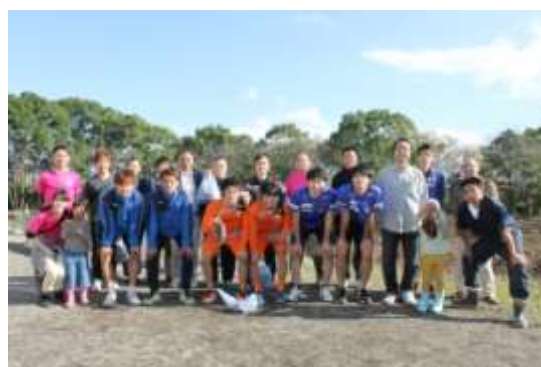
< さつまいもの収穫祭の様子 >