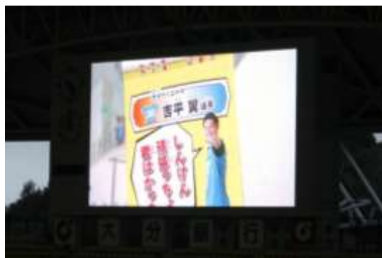
〈 大型ビジョンでのPRの様子 〉