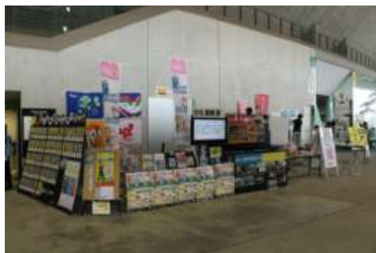
〈 協議会ブースの様子 〉

・大型ビジョンにて「おおいたスポーツ広場2016」の告知、「協議会ブース」のPR