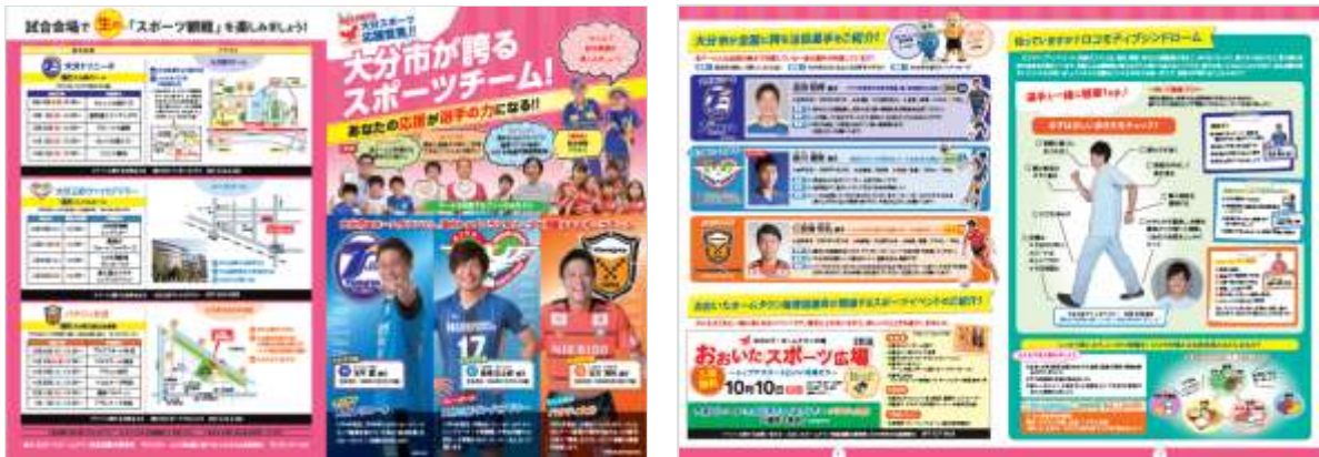
〈リーフレット 外面〉