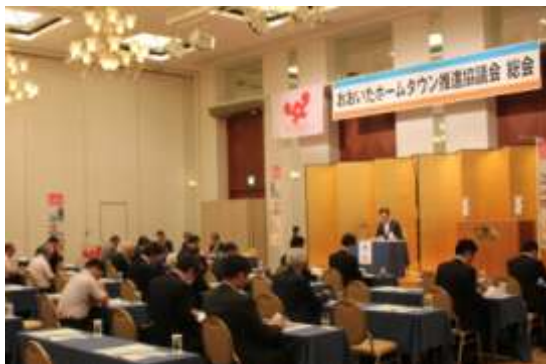
< 総会の様子 >

内 容 ・議案第1号 平成27年度 事業報告について ・議案第2号 平成27年度 決算報告及び会計監査報告について ・議案第3号 平成28年度 監事選任について ・議案第4号 平成28年度 事業計画(案)について ・議案第5号 平成28年度 予算(案)について 報告、議案について全て承認された。 総会終了後、タウスポ交流会を開催。(参加者数72名)