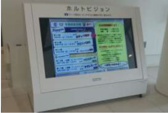
＜ デジタルサイネージ ＞