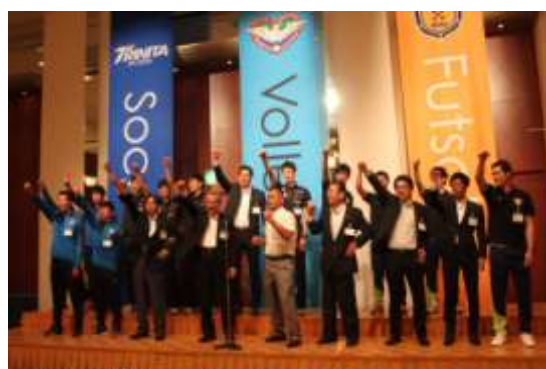
< 会員、パートナーチームによるガンバロー三唱 >