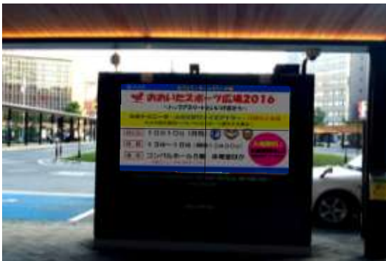
＜ 大分駅府内中央口広場のデジタルサイネージ ＞