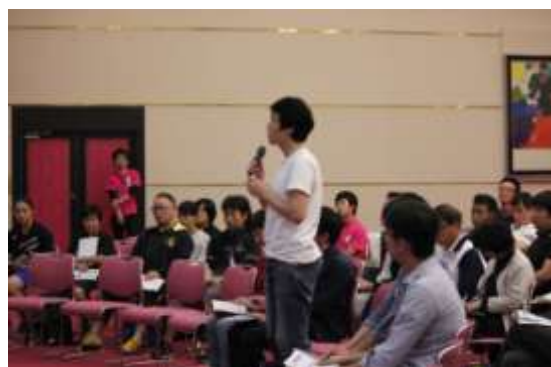
〈 タウスポコーチングカレッジの様子 〉