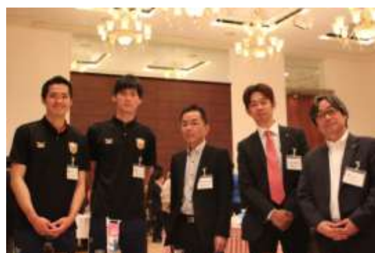
< タウスポ交流会の様子② >