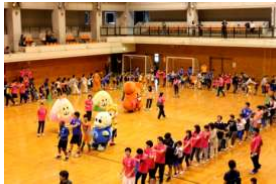
〈 おおいたスポーツ広場 2016 の様子 〉