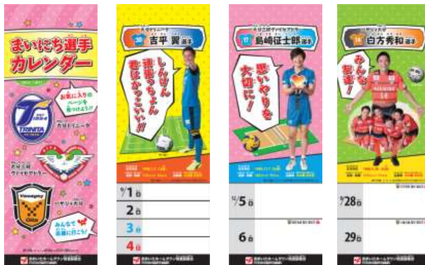
〈 まいにち選手カレンダー 〉