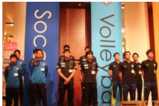
< タウスポ交流会の様子① >