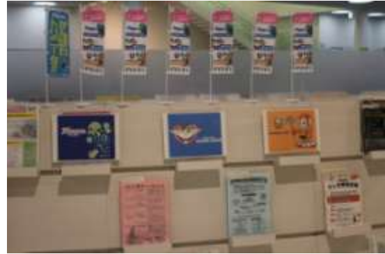
＜ ミニコーナー ＞