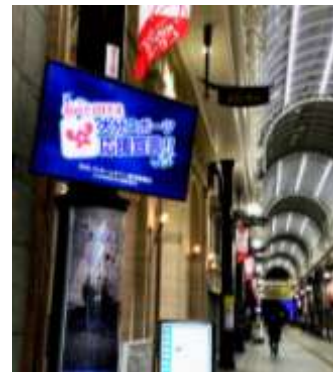
＜ ガレリア竹町のビジョン「monita」 ＞