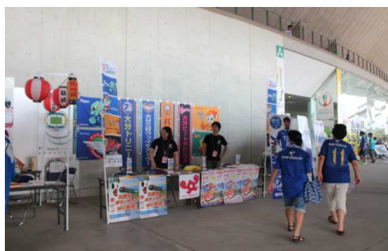
〈協議会ブースの様子〉

内 容 ・ 4チームの等身大パネル及び協議会幟・旗の設置 ・ 観戦ガイドの配置・配布 ・ おおいたスポーツ広場2013チラシの配布及び大型ビジョンによるPR