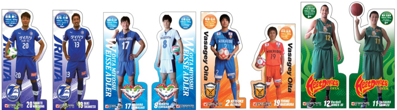
〈4チーム選手等身大パネル〉

選手の等身大パネルを作成し、地域交流イベントや試合会場等に設置し4チームのPRを行った。