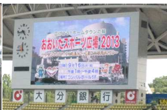
〈ビジョンでのPRの様子〉