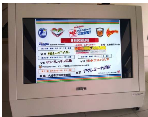
〈デジタルサイネージ〉

「ホルトホール大分」のデジタルサイネージを活用し、4チームの試合日程等を告知するとともに、エントランス内に協議会のミニコーナーを設置した。