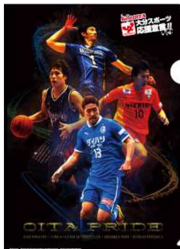
〈クリアファイル表〉

4チームの選手写真と試合日程を入れたタウスポオリジナルクリアファイルを作成し、大分市内小学校全児童(27, 200枚)、おおいたスポーツ広場2013来場者(1, 300枚)等に配布し4チームのPRを行った。 ※別添資料 参照