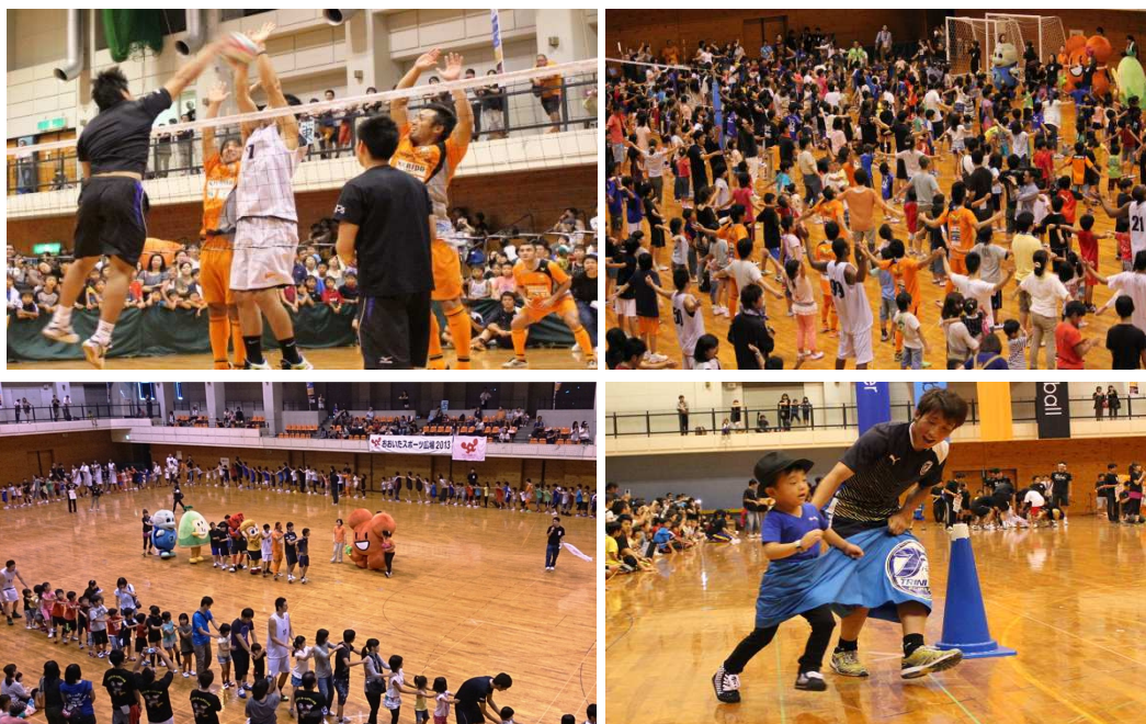
〈おおいたスポーツ広場2013の様子〉

内 容 (企画運営会議委員13名、大分県立看護科学大学16名を含む) 競技体験コーナー、選手デモンストレーション、チーム対抗デカパンツ競争、みんなで一緒にジャンケン列車・ジェンカ等