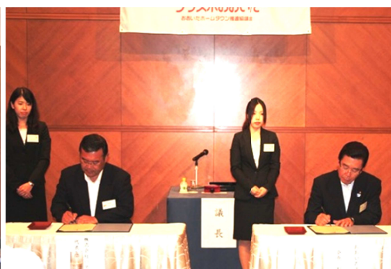
〈「(株)バスケで」との調印の様子〉