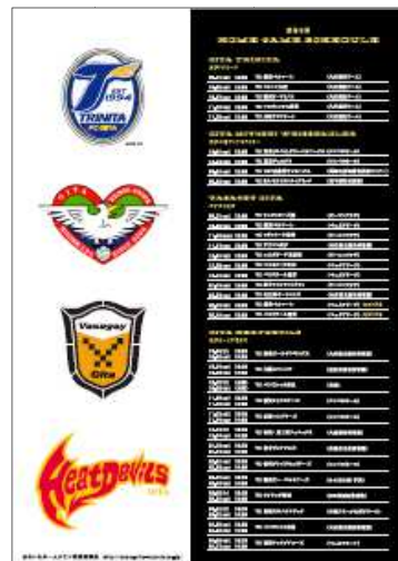
〈クリアファイル裏〉