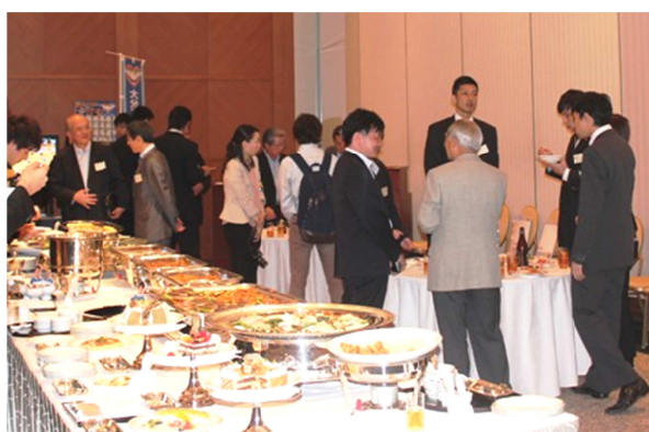
〈タウスポ交流会の様子〉