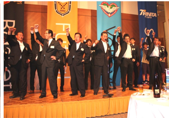
〈会員、パートナーチームによるガンバラロー三唱〉